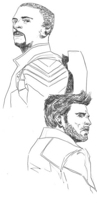
Ilustração: Murilo Cruz Donizeti

Um dos principais temas tratados na série é o racismo, sendo que um dos protagonistas é negro. O racismo é abordado em diversas situações no decorrer dos episódios, como na introdução do personagem Isaiah Bradley (Carl Lumbly), que é conhecido nos quadrinhos por ser o primeiro Capitão América negro. O companheirismo, o trabalho em equipe e o lidar com traumas do passado também estão presentes na série.